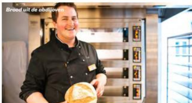
Brood uit de abdijoven