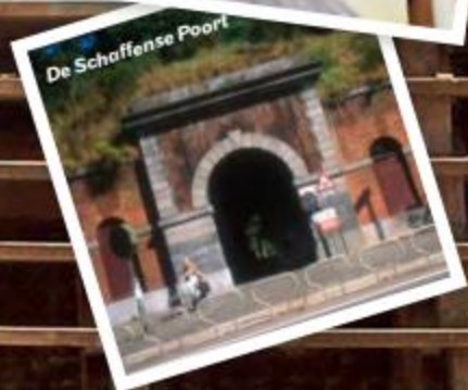
De Schaffense Poort

"De rust van het water in het levendige Diest."