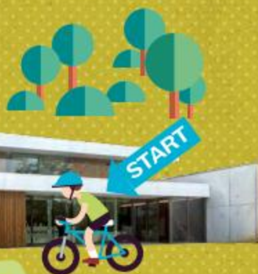
Sven Nys Cycling Center Balenbergstraatje 11 3126 Beal

Haal de fiets- en wandelkaarten in huis via: www.toerismevlaamsbrabant.be