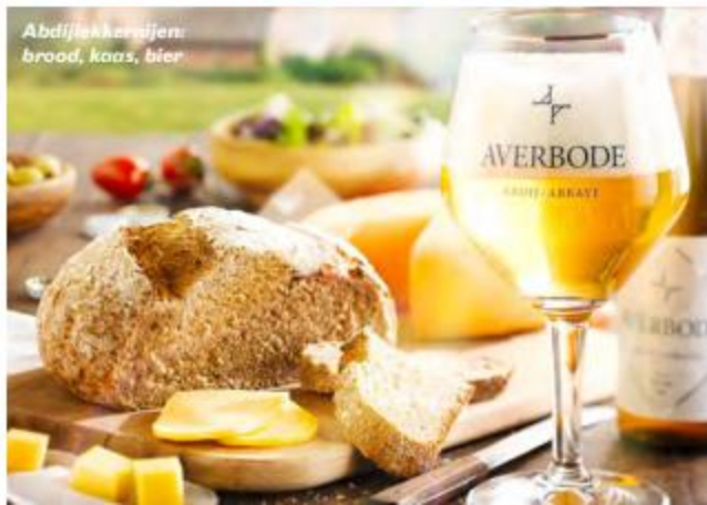
Abdijslekkertjes: brood, kaas, bier