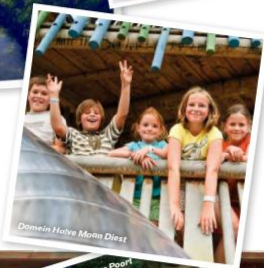
Domein Halve Maan Diest