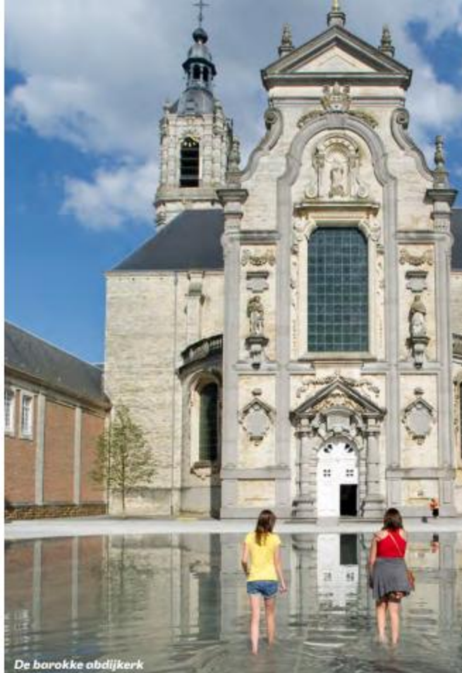
De barokke abdijkerk

Brood, kaas, wat ontbreekt er nog? Juist, ja. 'Na honderd jaar werd het tijd dat er opnieuw gebrouwen werd in de abdij. In onze eigen huisbrouwerij maken we het Averbode Momentum bier. Je vindt het niet in de winkels, we tappen het alleen in het abdijscafé. Rechtstreeks uit de brouwketel.' Voor de liefhebbers: Averbode Momentum is een ongefilterd en licht troebel bier van 5,7% alcohol. Met een moutzoetige en hoppige