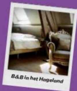
B&B in het Hageland

Ofwel een gastvrije B&B in het Hageland boeken via www.toerismevlaamsbrabant.be . Ofwel kiezen we voor het hoparrangement van Charmehotel Den Berg in Londerzeel. Met een lekker hopmenu erbij.