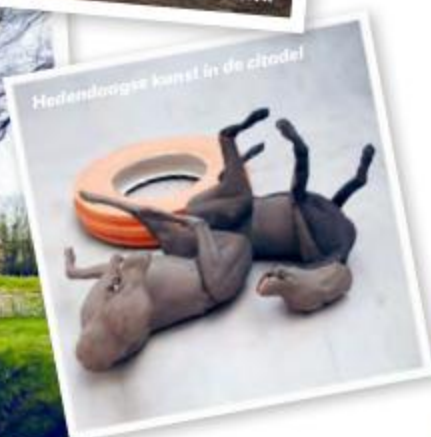
Hedendaagse kunst in de citadel