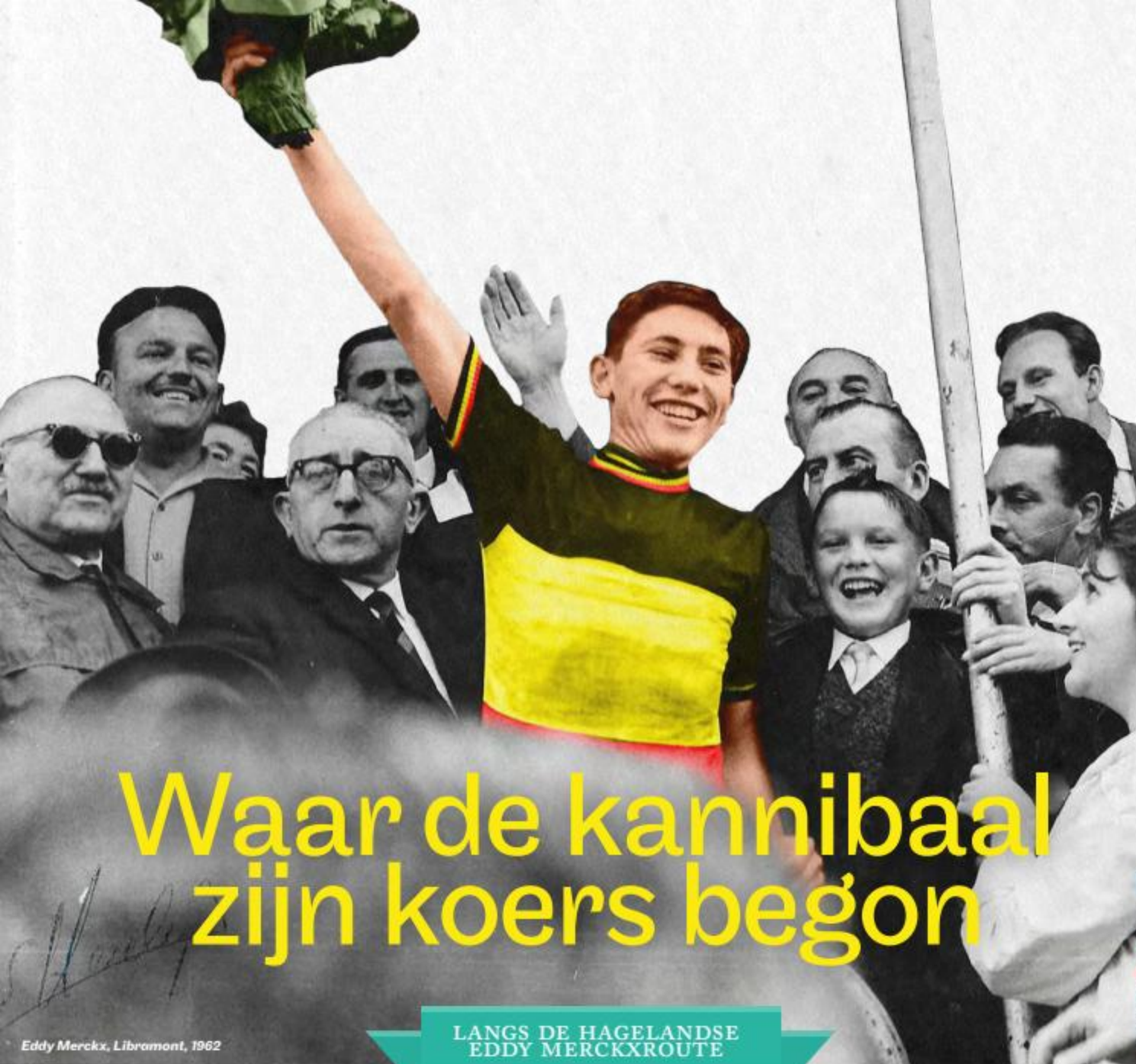
Eddy Merckx, Libramont, 1962