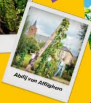
Abdij van Affligem