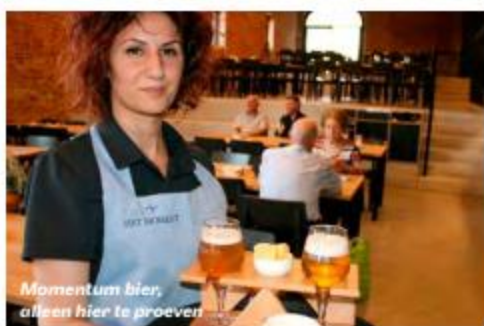
Momentum bier, alleen hier te proeven