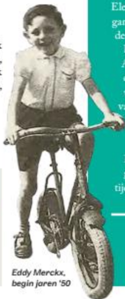
Eddy Merckx, begin jaren '50

Via kleine wegetjes kwam ik uiteindelijk toch aan de finish, nog voor de koplopers zelfs. Ik werd natuurlijk gedeclasseerd, lacht hij.